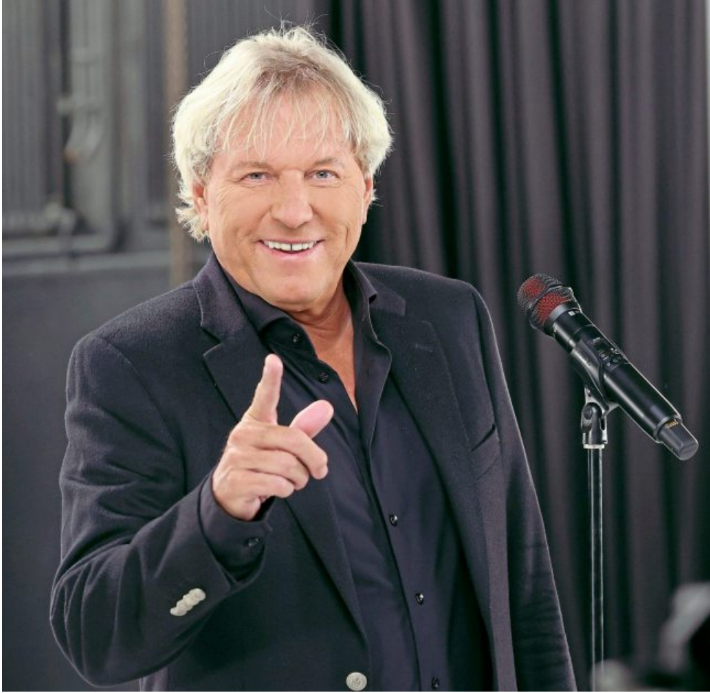
Bernhard Brink kommt am 24. Juni zu einem Kurzkonzert in den SÜDRING-Center.

Sieben brandneue Songs sowie sieben starke Neuinterpretationen hält der „Schlagertitan“ auf dem neuen Album für seine Fans bereit. Die musikalischen